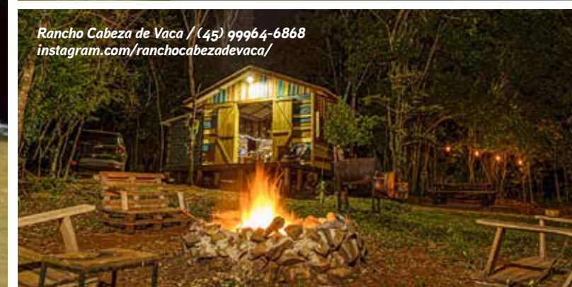
Rancho Cabeza de Vaca / (45) 99964-6868 instagram.com/ranchocabezadevaca/

choeira, quiosques, açudes para pescaria e um chalé para quem deseja pernoitar. "Começamos há dois anos e temos visitantes, mas sempre podemos melhorar. Agora por exemplo eu estou investindo num local para o pessoal poder acampar", compartilhou.