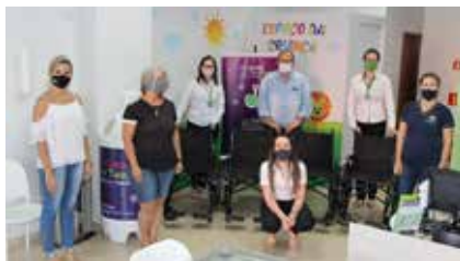
Dez cadeiras de rodas doadas em mais uma campanha, com apoio do Sindicato Rural de Cascavel

No fim de fevereiro, a Unimed Cascavel entregou dez cadeiras de rodas compradas por meio da 7ª edição da campanha "Doe Lacres. Doe tampinhas". Entre fevereiro de 2020 e janeiro de 2021, junto com diversos parceiros, como o Sindicato Rural de Cascavel, foram arrecadados 870,4 kg de lacres de latinhas de