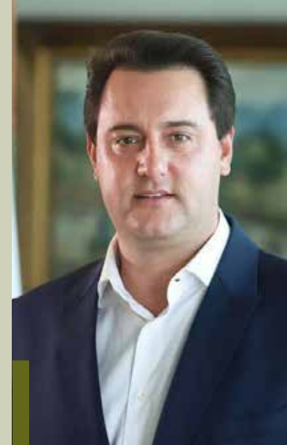
Governador Ratinho Jr: a dúvida é se ele ficará do lado dos paranaenses

"Pelo menos isso o governo federal já mudou. Disse que toda essa ou-