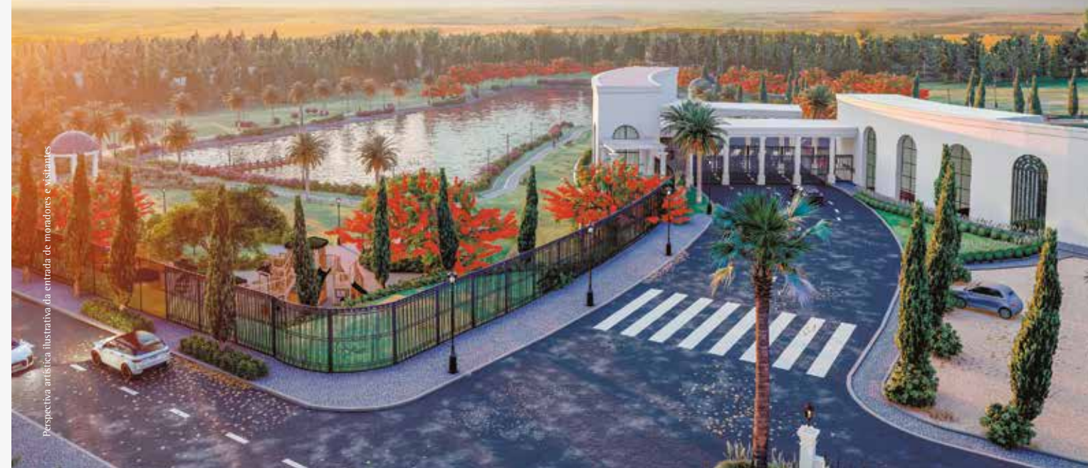
Perspectiva artística ilustrativa da entrada de moradores e visitantes.

O espaço que você procura para ser feliz.