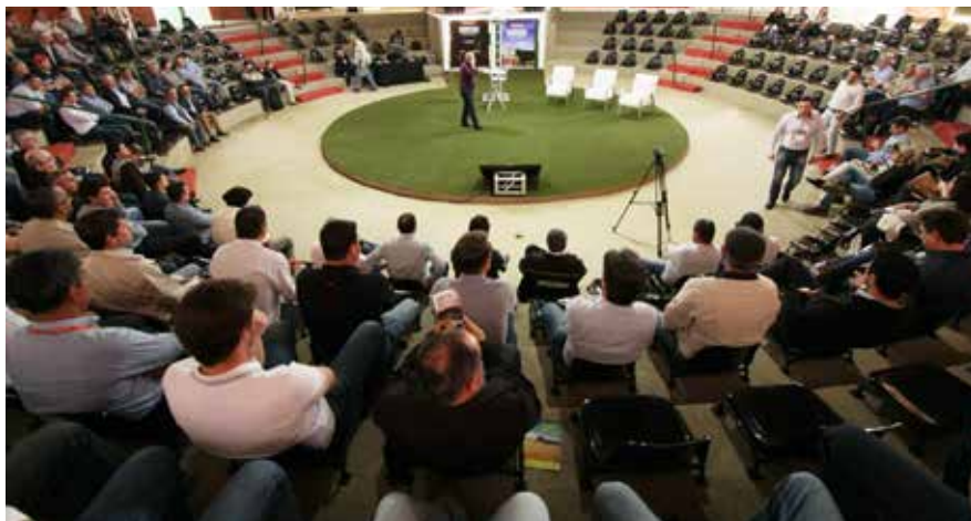
Depois de 5 edições presenciais, evento se tornou online em 2020

Com a pandemia, a edição migrou para o formato on-line em 2020, que foi um sucesso. "Trouxemos palestrantes de qualidade e tivemos muitas visualizações. Foi uma experiência nova