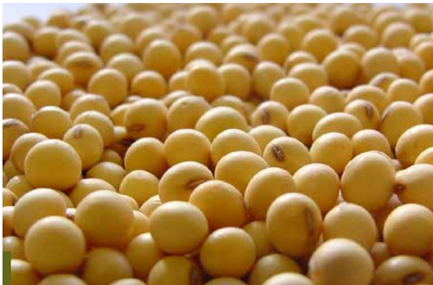
Novas regras começaram a valer no dia 21 de março

A nova legislação faz uma atualização em vários pontos importantes das regras que regem o Sistema Nacional de Sementes e Mudas e no que se aplica ao produtor rural, que, nesse sistema, é chamado de usuário de sementes e mudas. O texto trata das regras para cumprir os termos do chamado Registro