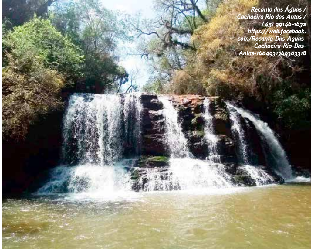
Recanto das Águas / Cachoeira Rio das Antas / (45) 99146-1632 https://web.facebook.com/Recanto-Das-Aguas-Cachoeira-Rio-Das-Antas-1609931369303318