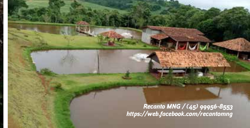
Recanto MNG / (45) 99956-8553 https://web.facebook.com/recantomng