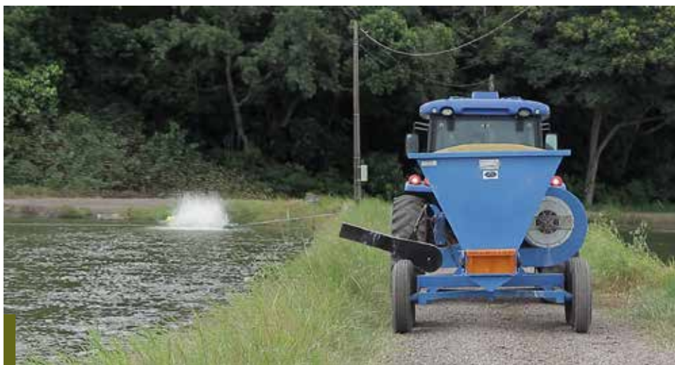
O distribuidor a sopro tem aplicação lateral e pode ser usado com ração, calcário e cal virgem

O Distribuidor AG Turbo 2000X, AG Turbo 3000X e AG Turbo 4000X são produtos cria-