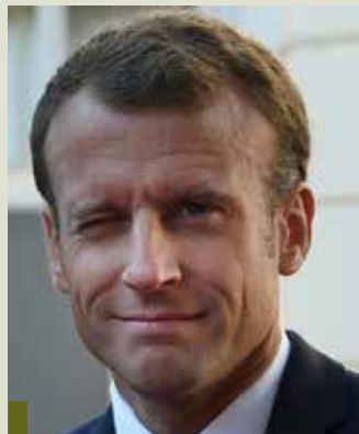
Macron: tweet polêmico

Em recente comentário, o presidente da França, Emmanuel Macron, afirmou que "continuar a depender da soja brasileira seria ser conivente com o desmatamento da Amazônia". No vídeo publicado em sua conta oficial no Twitter, o presidente francês falou em "não depender mais" da soja brasileira e produzir o grão na Europa. "Nós somos coerentes com nossas ambições ecológicas, estamos lutando para produzir soja na Europa", disse.