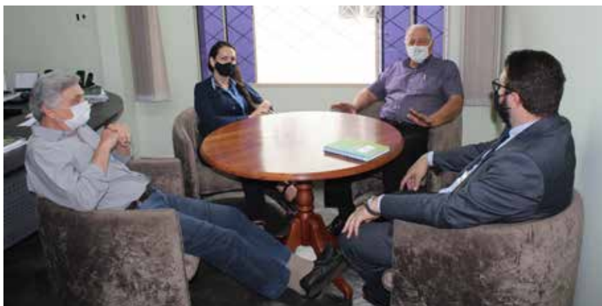
Equipe da Caixa apresentou as linhas de financiamento para agricultores

As taxas praticadas atualmente são: Pronaf, a partir de 2,75%; Pronamp investimento a partir de 5%; custeio a partir de 4%; demais produtores custeio a partir de 5%; investi-