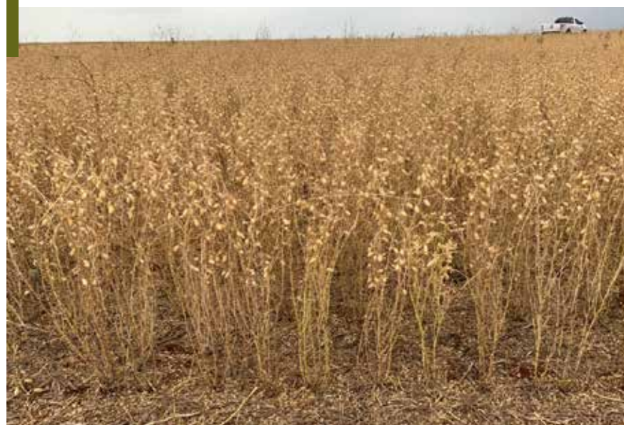
O grão-de-bico é a aposta como alternativa para culturas de inverno no Oeste do Paraná

Na região Oeste do Paraná, a ideia de plantar pulses surgiu como uma excelente al-