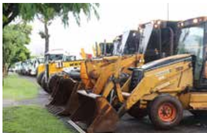
Mutirão da Prefeitura de Cascavel consertou várias estradas rurais danificadas pelas chuvas

"Mesmo com chuva nossas equipes trabalharam. Estamos retirando cascalho, levando para os trechos críticos, espalhando e compactando. Nós temos mais de 399 quilômetros de