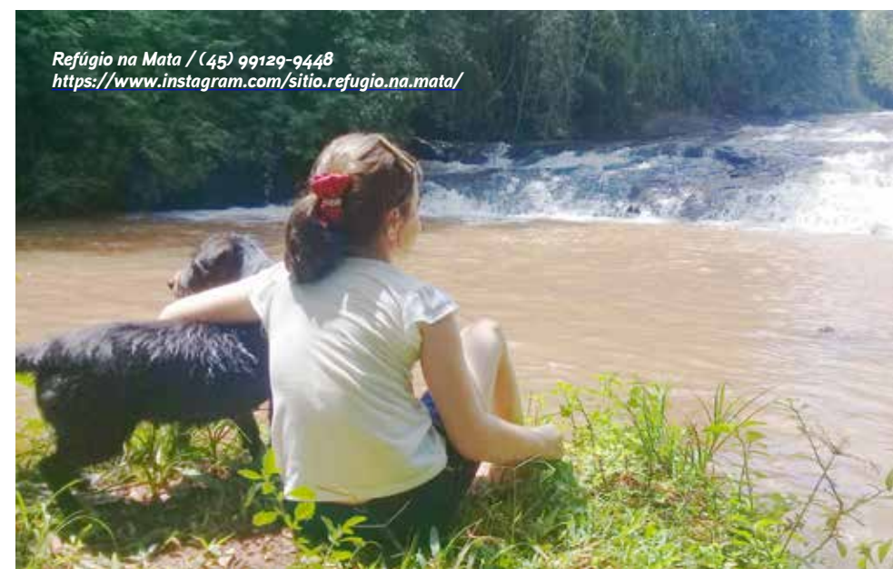
Refúgio na Mata / (45) 99129-9448 https://www.instagram.com/sitio.refugio.na.mata/